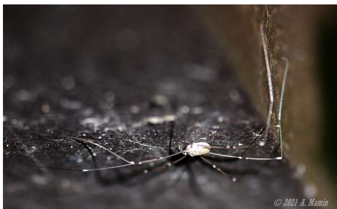
Opilion en balade