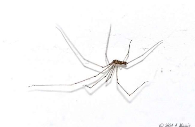
Araignée « pholque » au plafond

Les différences majeures de l'opilion avec les araignées sont :